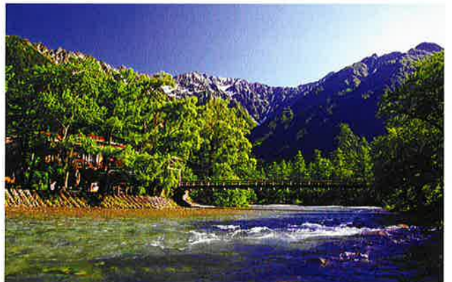
松本市上高地・河童橋