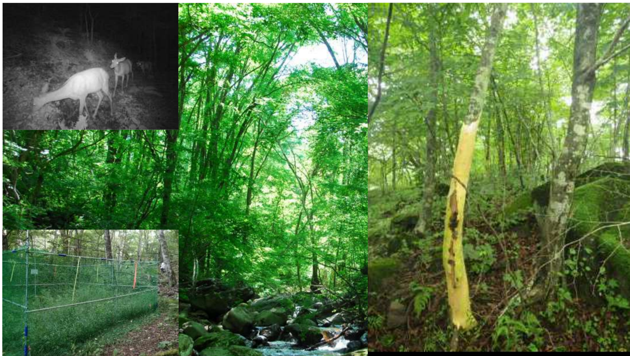
(左上) センサーカメラに映ったシカたち (左下) 植生回復柵の内側と外側の違い (右) シカの樹皮剥ぎの痕