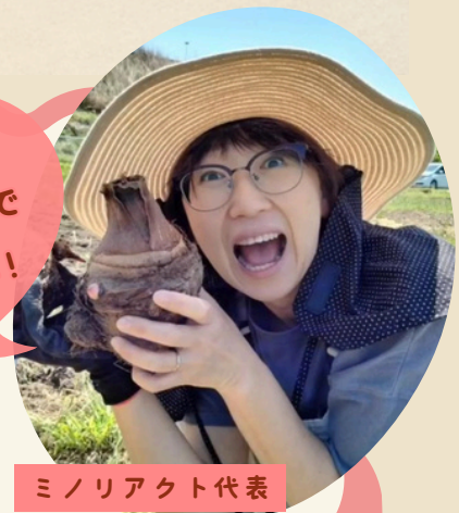
ミノリアクト代表