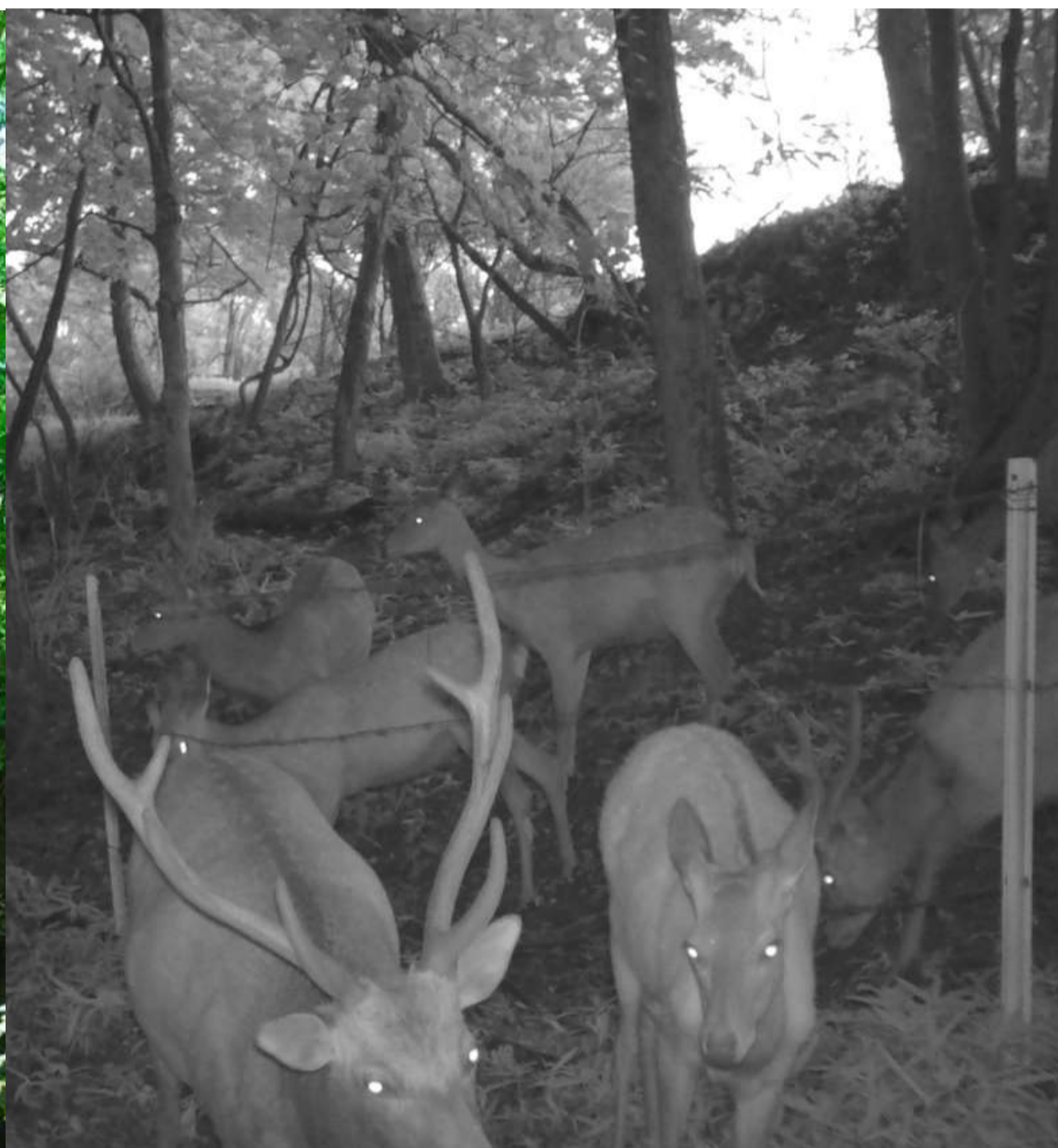
(右) 8月17日午前4時53分 望月高原牧場脇のニホンジカの群れ