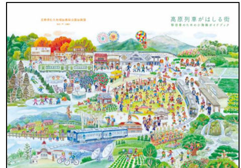
表紙・裏表紙のイラスト