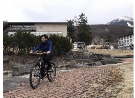
蓼科山麓を楽しむ