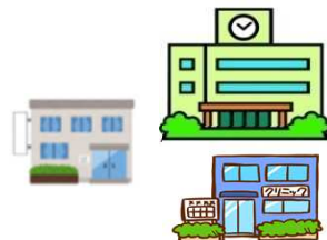
かかりつけ医療機能を担う医療機関