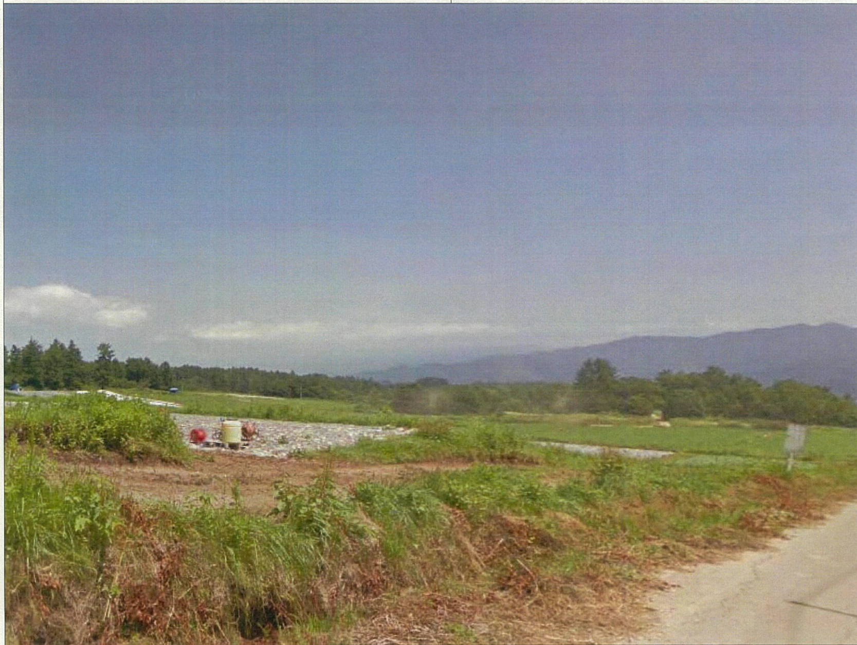
行為前の状況 行為地中心から半径3km内任意の眺望点