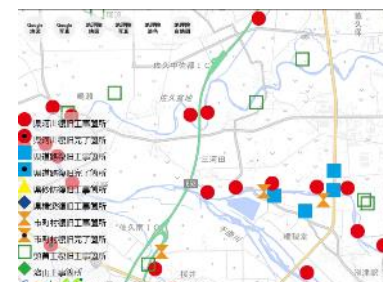
国土地理院淡色地図