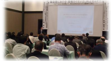
▲セミナーの開催状況