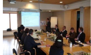
▲海外の大学等との技術交流