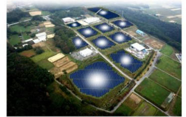
▲県営産業団地に設置予定の太陽光発電所完成予想図