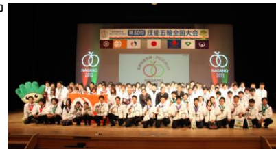
▲第50回技能五輪全国大会開会式の様相