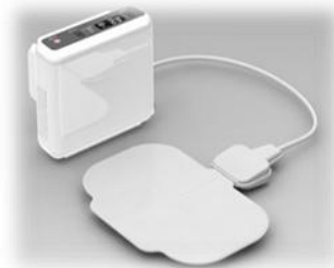
▲開発した冷却温度調整機能を備えた快適介護・看護用品