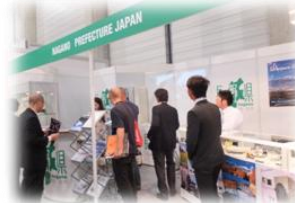
▲海外展示会への出展支援状況