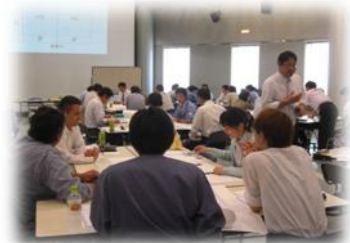
▲マーケティングスキル向上セミナーの開催状況