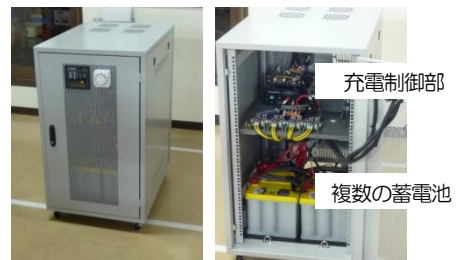
▲開発した高効率蓄電池充電システム