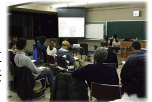
▲起業家交流会の開催状況