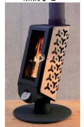
▲新デザインにより暖房効率も向上した薪ストーブ