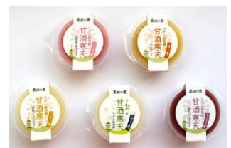
▲乳酸菌発酵により甘酒味にさわやかさを加えた寒天デザート