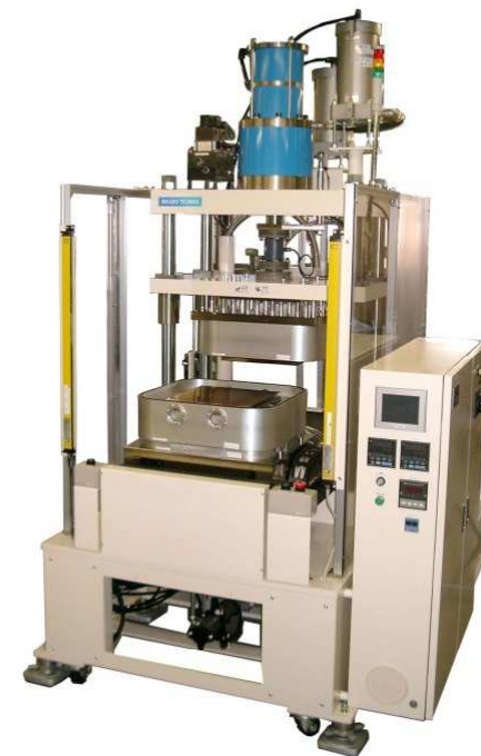
(VACUUM NEO 400°C対応モデル)