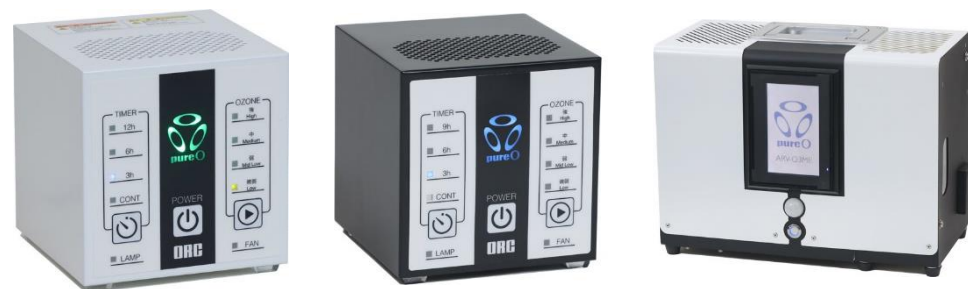
(エアービーナスシリーズ)

ピュアなオゾンが空間の隅々まで広がり、効果的に細菌やウイルスを不活化 (無害化)。 有害なNOx (窒素酸化物) を含まないため、金属や樹脂へのダメージが少なく、今までオゾンをご使用できなかった電子機器や精密機器などが置かれた空間や、有人空間でも安全・安心に使用可能。