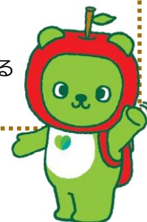
長野県PRキャラクター『アルクマ』 ©長野県アルクマ