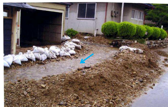
⑥ H18.7豪雨 土砂流出状況