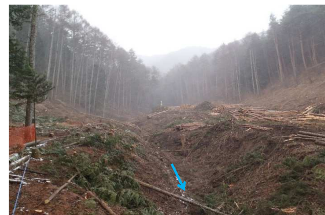
① 堰堤工 着手前