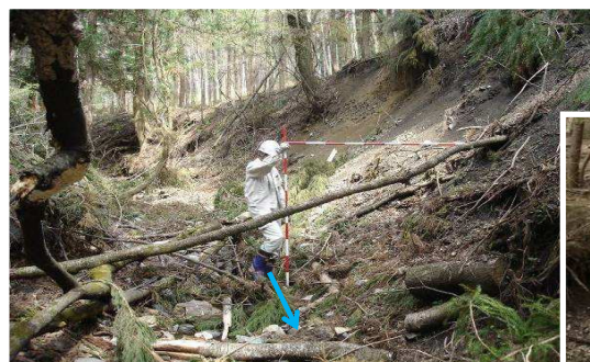
③ H18災 荒廃状況