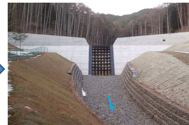
① 堰堤工 完成