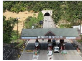
料金所（白馬長野有料道路）