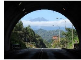
日高トンネルから白馬方面を臨む