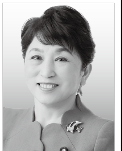
社民党党首 福島みずほ