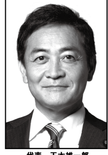
代表 玉木 雄一郎