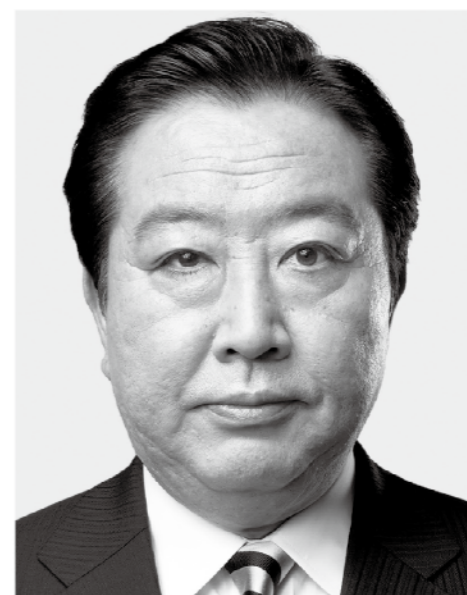
立憲民主党 代表 野田佳彦

7 共生社会 多様性を認め合える当たり前の社会 ●選択的夫婦別姓制度を実現 ●ジェンダー平等を着実に推進