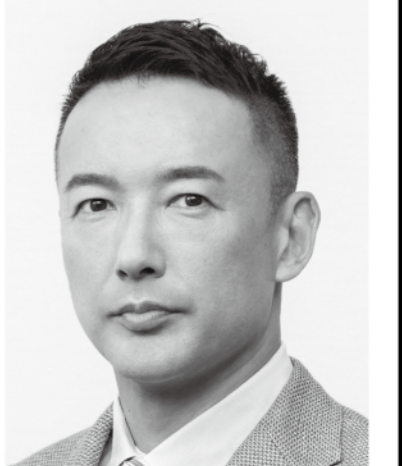
れいわ新選組 代表 山本太郎