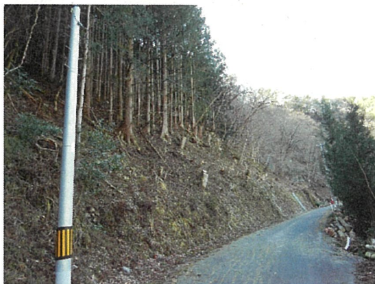
ライフライン等保全のための支障木伐採 (天龍村 鶯巣宇連地区)