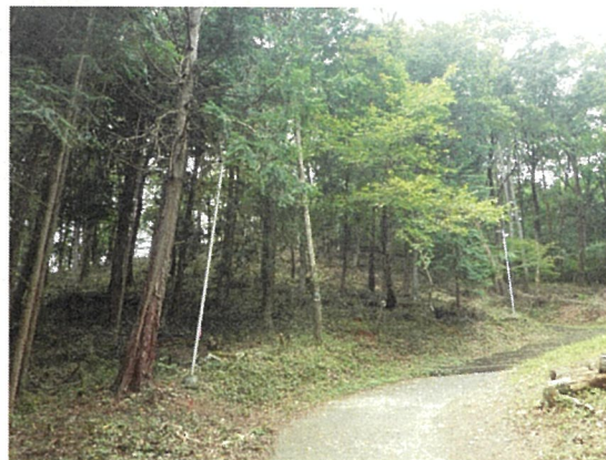
緩衝帯の整備 通学路沿いの鳥獣対策 (飯田市 座光寺地区)