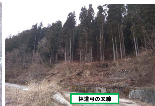
伐採木搬出箇所近景