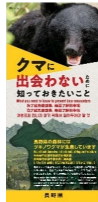
リーフレット (観光客向け)