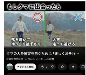
動画 「正しくおそれ 正しく備える」