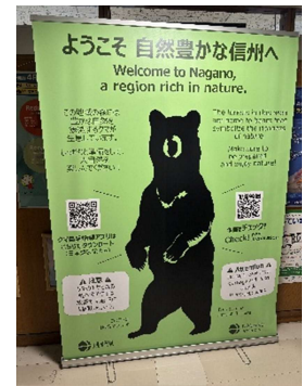
ツキノワグマ等身大パネル