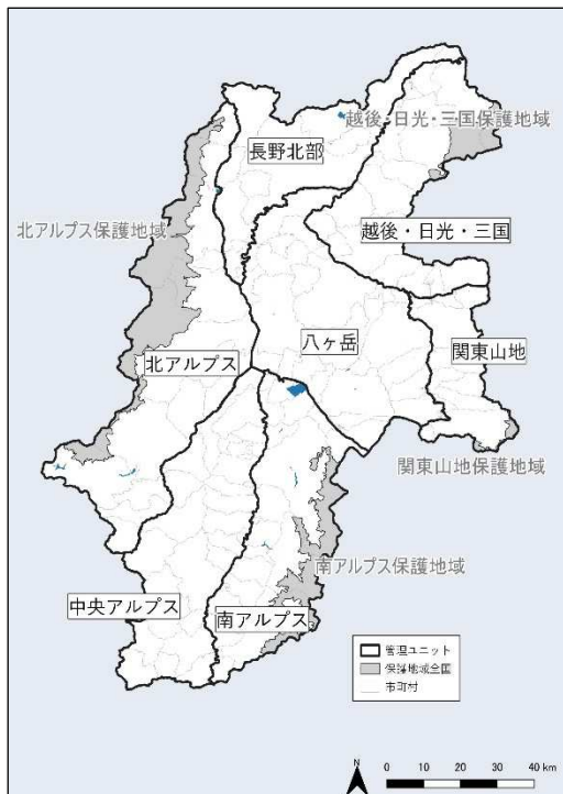
図-1 カモシカの管理ユニットと保護地域