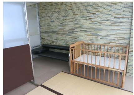
1階ベビールーム内