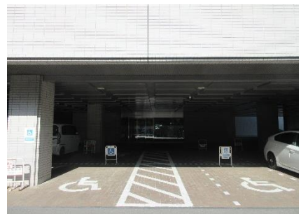
議会棟西側屋根下