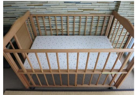
1階ベビールーム内