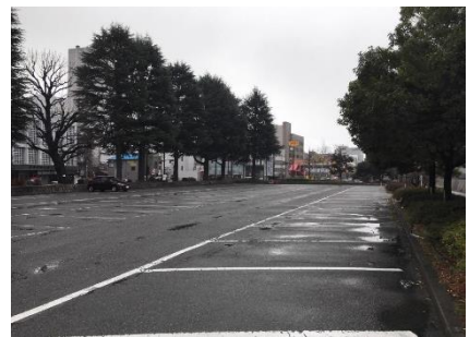
本館正面玄関側駐車場