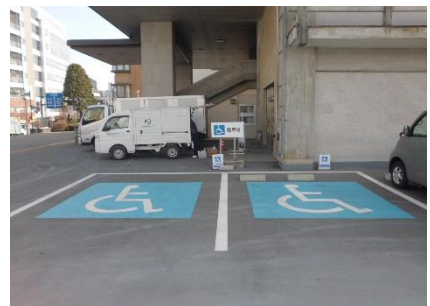
合同庁舎北側駐車場