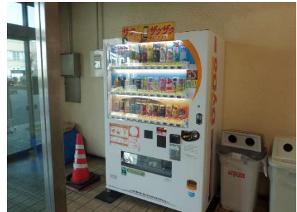
1階エントランスホール