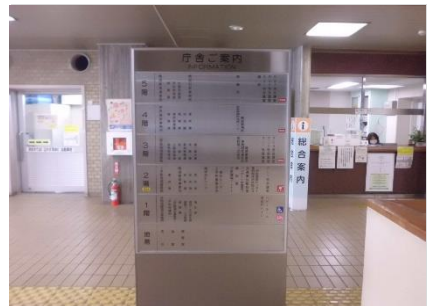
2階エントランスホール