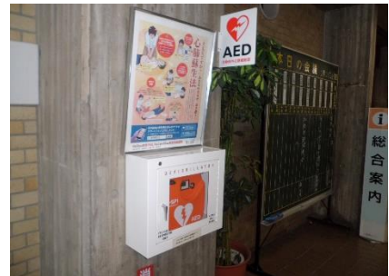
2階エントランスホール