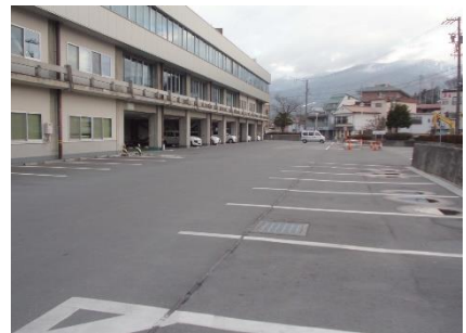
合同庁舎北側駐車場