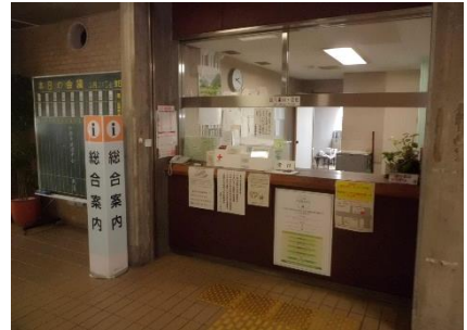
2階エントランスホール