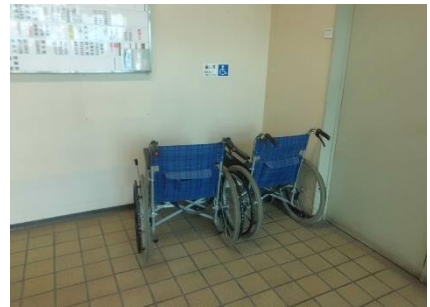
1階エントランスホール