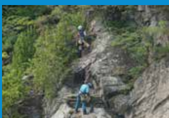
・クライマーによる崖面の作業