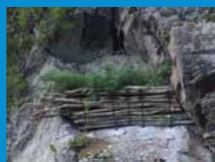
・人工的に復元された巣棚