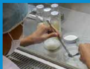
・種子から無菌培養で増殖