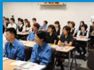
・社員への環境教育学習