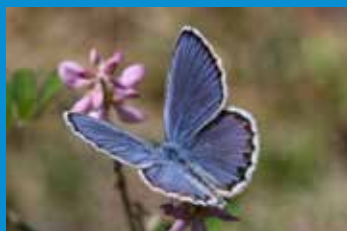
・制度初、第一号の協定