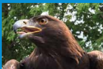
・県外企業の第一号協定