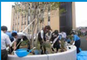
・同種保護区を本社に整備