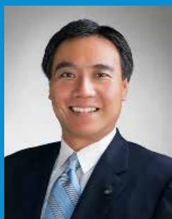
長野県知事 阿部 守一

長野県の自然環境は、「日本の屋根」と言われる3,000m級の高山や里地里山、湖沼など変化に富み、その「恵み」の下で多様な生物が育まれています。