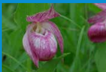
・企業と学校の初の協定