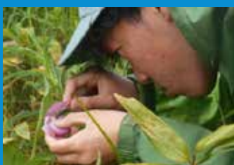
・野生個体の人工授粉作業