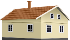
就労継続支援事業所等