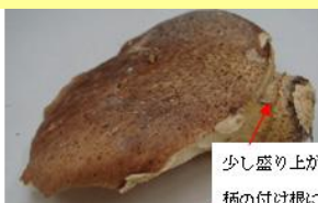
少し盛り上がったつばが柄の付け根にある