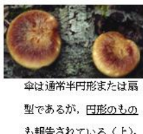
傘は通常半円形または扇型であるが、円形のものも報告されている(上)。

黒いシミがあるものが多い。黒いシミがほとんどないものもあるので注意が必要である。