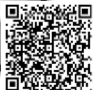
【動画】ノロウイルス等の食中毒予防のための適切な手洗い

https://www.youtube.com/watch?v=z7ifN95YVdM&feature=youtu.be