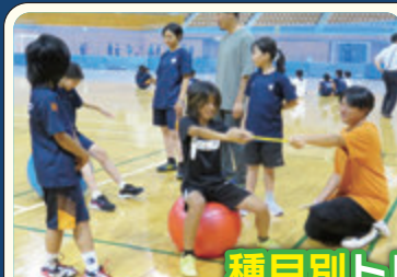
種目別トレーニング