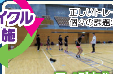
フィジカルトレーニング