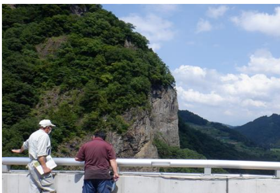
裾花ダムの堤頂見学の様子