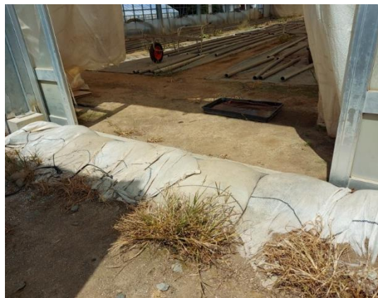
【豪雨時雨水が流入しないよう土嚢設置】