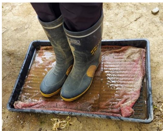
【育苗ハウス入口に消毒槽設置】