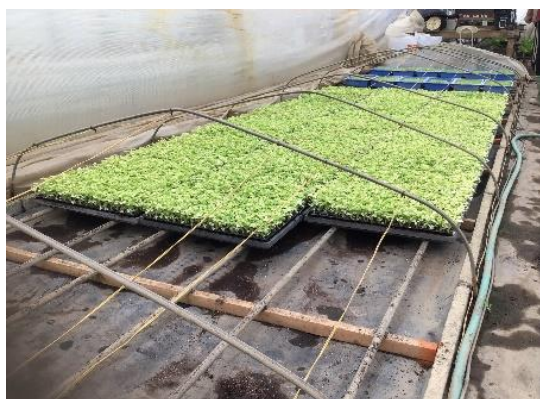
【地面へ直置きしないよう板枠設置】