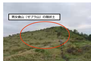
男女倉山（ゼブラ山）の階状土

男女倉山（ゼブラ山）の南東側の斜面を遠くから見ると、横方向に走るスジのような模様が確認できます。近くへ行ってみると、裸地と植生地が交互に形成されています。これは「階状土」と言われるもので、数千年という長い年月に及ぶ凍結と融解の繰り返しでできた地形で、山彦南北の耳にも存在します。日本の地形レッドデータブックに掲載されている貴重な環境資源です。