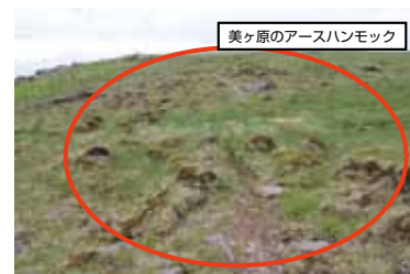
美ヶ原のアースハンモック

美ヶ原台上の茶臼山と塩くれ場の間には、直径1m、高さ20~30cmほどの「土まんじゅう」のような地形が点在します。これは「アースハンモック」と呼ばれ、やはり凍結融解作用により、地表面の砂や石がふるいにかけられるような作用の結果作り出される模様です。こちらも、日本の地形レッドデータブックに掲載されている貴重な環境資源です。