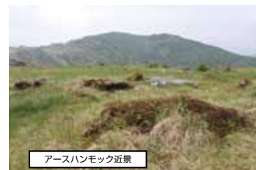
アースハンモック近景