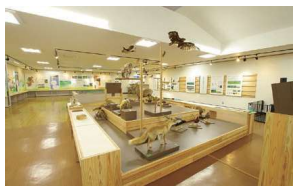
館内展示コーナー

霧ヶ峰自然保護センターは、1973年に長野県立の自然保護センターとして開館しました。館内では、霧ヶ峰で見られる動植物、地質や歴史などについて実物や写真パネルで紹介しています。2022年にリニューアルし、眺望の良いテラスのほか、映像や展示を通して霧ヶ峰の魅力を体感できる施設になりました。