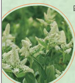
コバイケイソウ 6月