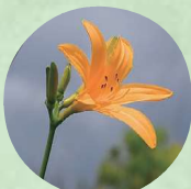
ニッコウキスゲ 7月