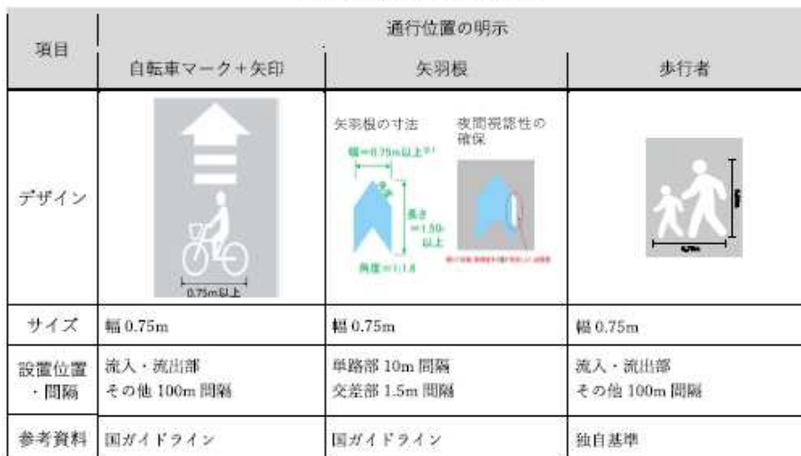
【路面表示（注意喚起等）】