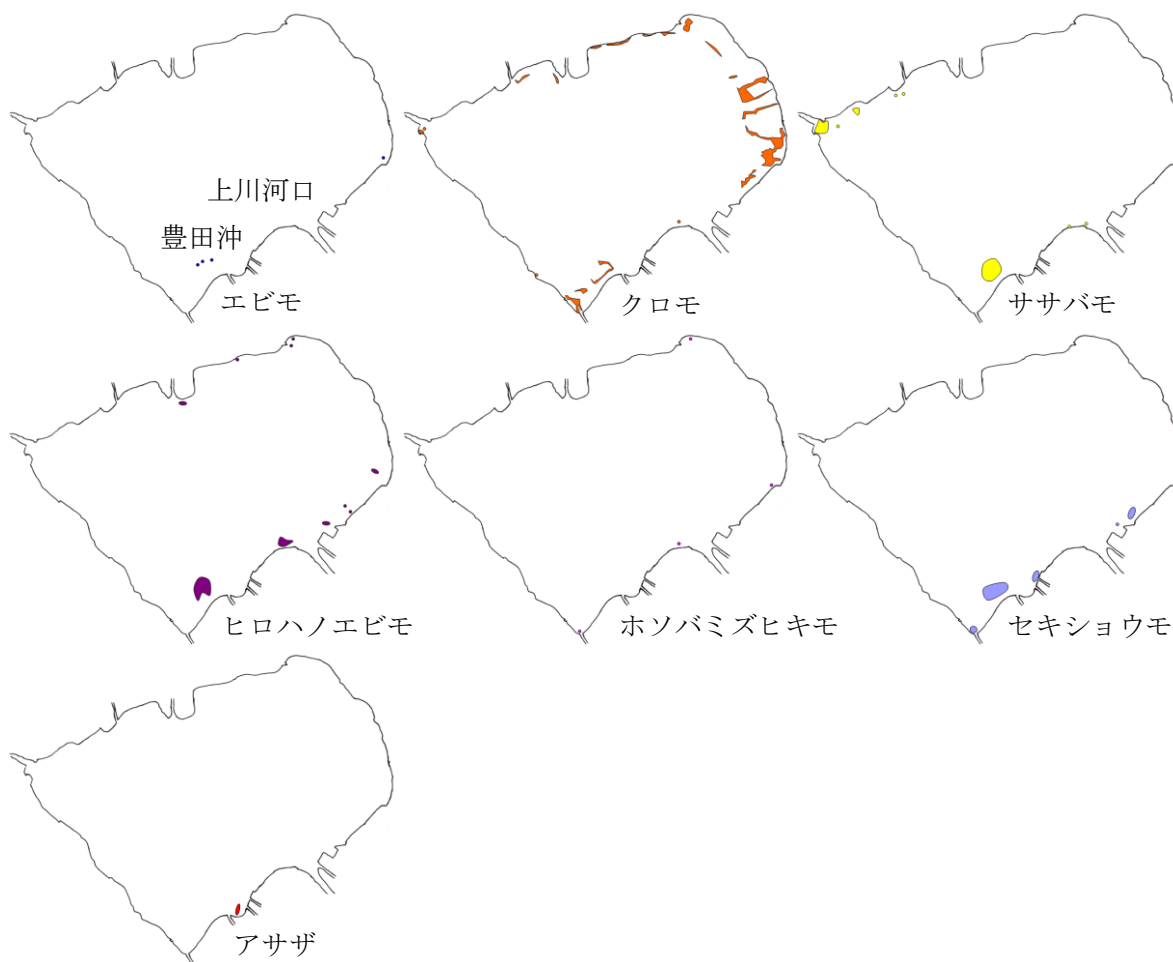
図 3 令和 4 年のヒシ以外の浮葉・沈水植物分布

ヒシ以外の浮葉植物、沈水植物の分布 ヒシ以外で群落が確認された浮葉・沈水植物は、エビモ、クロモ、ササバモ、ヒロハノエビモ、ホソバミズヒキモ、セキショウモ、アサザの 7 種であった（図 3）。