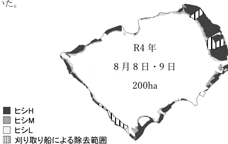
図 2 令和 4 年度のヒシの分布

本年の密度 H の範囲は、漕艇場内や上川河口などの一部を除き、諏訪湖の湖岸全周に渡って分布しており、大きな経年変化はなかった（図 2）。特に諏訪湖北東岸の高浜から高木にかけての範囲では、ヒシの分布が沖まで広がっており、その張り出しの大小で、諏訪湖全体のヒシ繁茂は左右されていた。