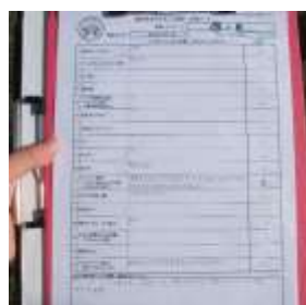
(表面) 調査記録シート