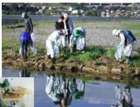
水辺での調査実施中