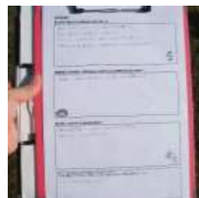
(裏面) ふりかえりシート