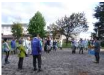
オリエンテーションの様子