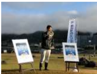
開会式 メイン会場(エリア③)