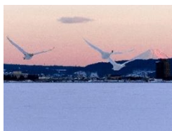
「諏訪湖創生ビジョン」フォト・イラスト作品入賞作品より