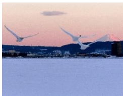
「諏訪湖創生ビジョン」フォト・イラスト作品入賞作品より