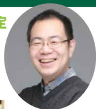
ファシリテーター