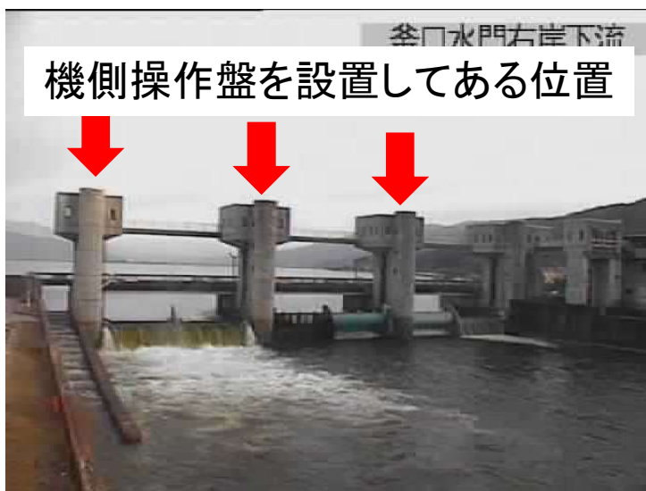
機側操作盤の位置