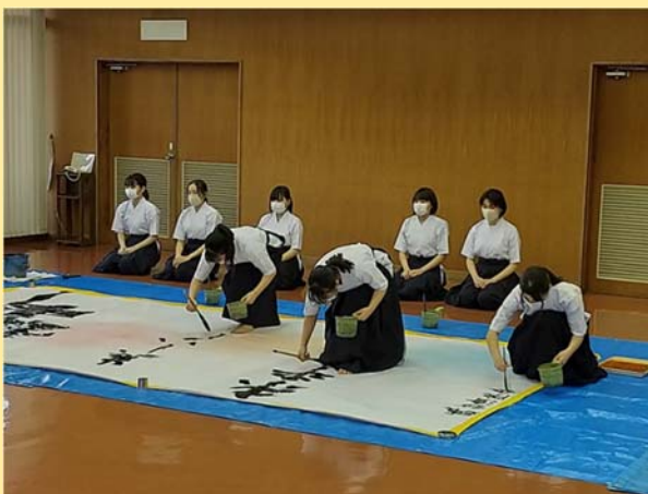
息の合った迫力のあるパフォーマンス！