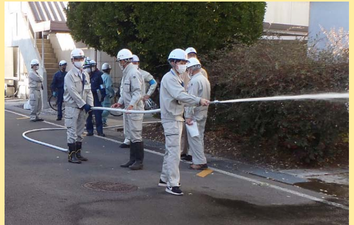
消火栓による放水訓練