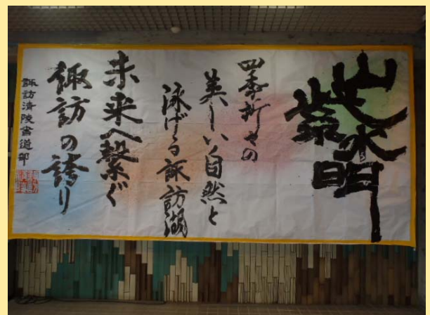
管理本館1階ロビーに展示中です