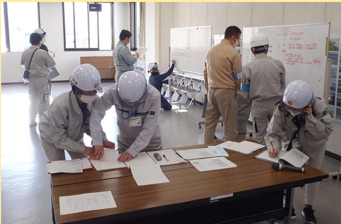
災害対策本部の活動状況

今回の訓練により、各自役割を確認するとともに、防災意識の向上につながりました。災害はいつ起きるか分かりません。災害発生時に訓練した事項を活かし、迅速かつ適切に対応します。