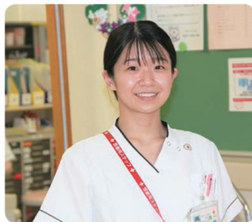
長野赤十字病院 C3病棟勤務