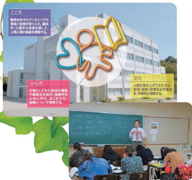
本校（須坂看護専門学校）での大学出張スクーリング授業の様子。