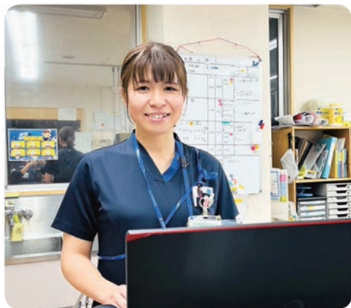
社会医療法人 健和会病院 循環器内科勤務