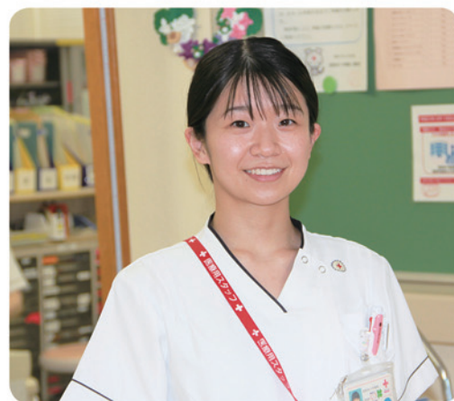
長野赤十字病院 C3病棟勤務