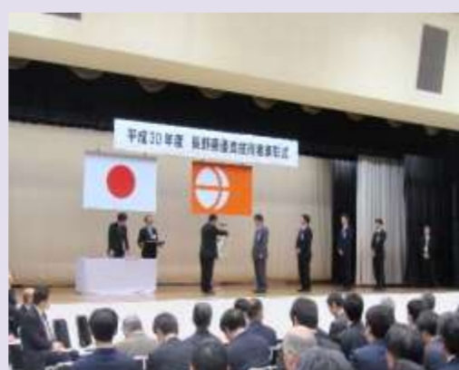
賞状をお一人ごとに手渡し