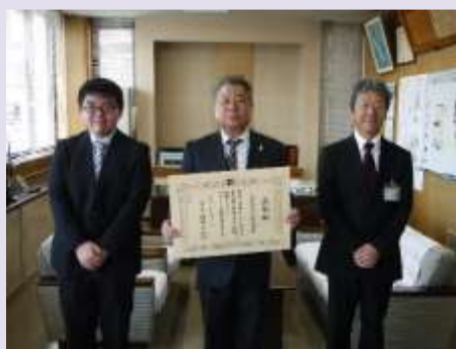
八木沢川河川愛護会の代表者様

道路河川愛護活動知事感謝状は、長年にわたり道路や河川の愛護に努め、その功績が特に顕著であった団体に対して伝達されるものです。当所管内では今回を含め36団体に感謝状が贈呈されています。