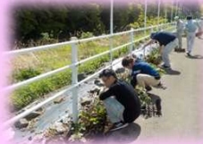
今年度は、須坂市職員10名と須坂建設事務所職員21名で作業を行いました。

5月15日(水)に、フラワーロード(主)長野須坂インター線で、須坂市と建設事務所で約400m間でサルビアの花植えを行いました。