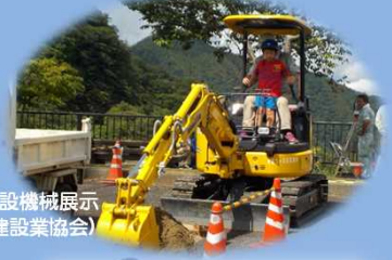
建設機械展示 (建設業協会)