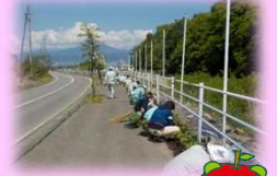
毎年恒例で20年近く続いています。