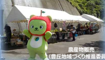
農産物販売 (豊丘地域づくり推進委員会)