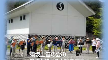
須坂土笛の会 皆さんによる土笛の演奏