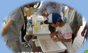
水質検査体験 (長野保健福祉事務所 検査課)