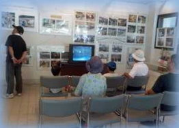
豊丘ダム説明 (ビデオ上映等)