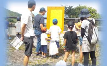
宝探しウォーク (豊丘地域づくり推進委員会)