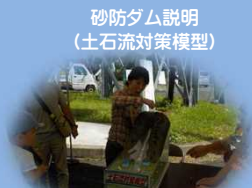
砂防ダム説明 (土石流対策模型)