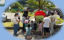
アルクマも遊びに来たよ!!