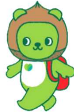
長野県PRキャラクター「アルクマ」 ©長野県アルクマ

真剣に取り組む姿がとても印象的でした！ 「快適で安全な環境を整えるため」 一緒に働ける日を楽しみにしています。 ※こちらの記事はTwitterに掲載しています。