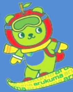
長野県PRキャラクター「アルクマ」 ©長野県アルクマ