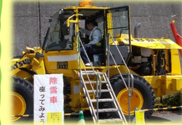
◎建設機械展示・体験