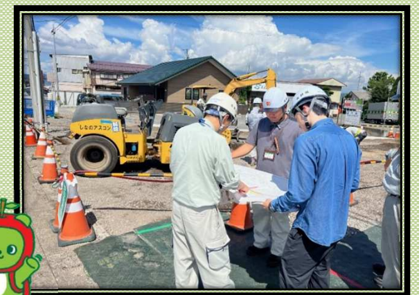
【道路改良工事現場】

8月19日から21日の3日間、インターンシップを実施しました。初日と2日目に事業内容説明や現場見学を、最終日には若手職員との気軽な意見交換会も行いました。