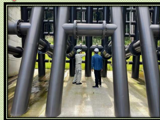
【砂防堰堤(須坂市仁礼)】

この体験を進路の選択に役立てていただけたら嬉しいです。 県の建設行政に興味のある皆様、ぜひインターンシップにご参加ください。(例年6月頃に県ホームページで申し込みを受け付けています。)