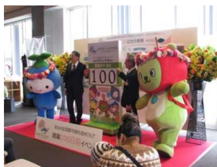
100日前イベント(安曇野市役所)