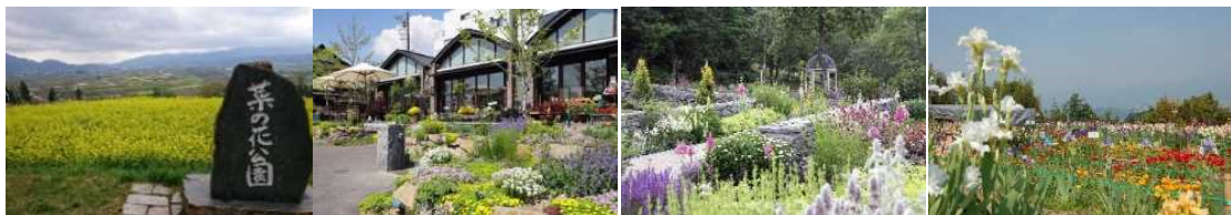
いいやま菜の花まつり(飯山市)

県内の花緑が楽しめる場所や催しを募集し、全市町村にある221件(164スポット、57イベント)を登録。現在ガイドブックの制作とスタンプラリーを準備中。