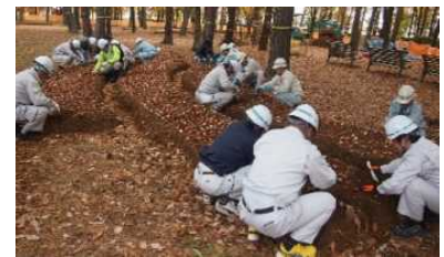
『あそびの森』植付け状況