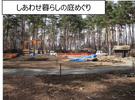
しあわせ暮らしの庭めぐり