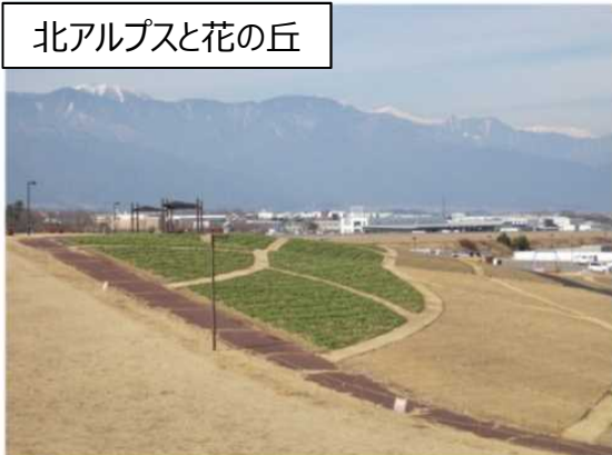
北アルプスと花の丘