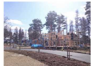
『信州リビングガーデン』