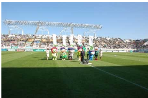
半年前イベント(サンプロアルウィン)