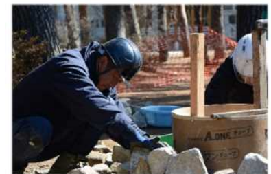
『しあわせ暮らしの庭めぐり』