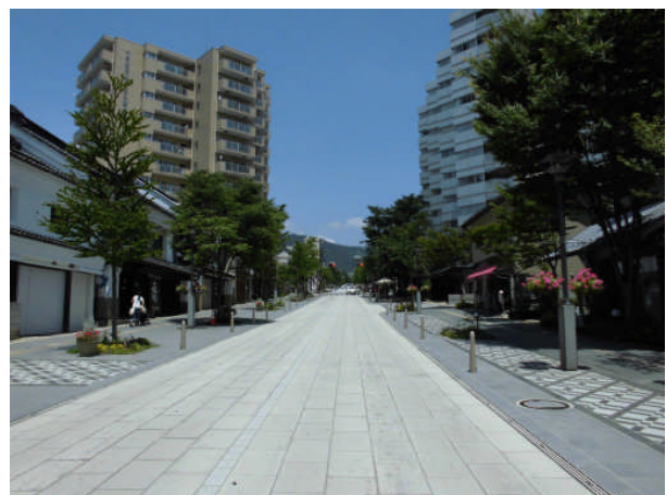
長野市の歩行者優先道路化整備事業