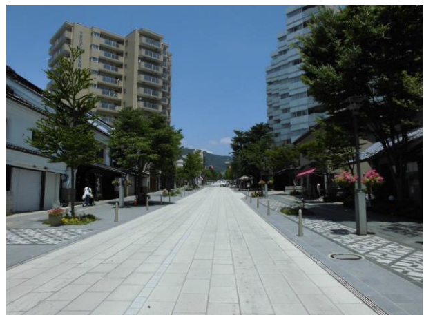
長野市の歩行者優先道路化整備事業