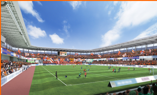
AC長野パルセイロ平均入場者数