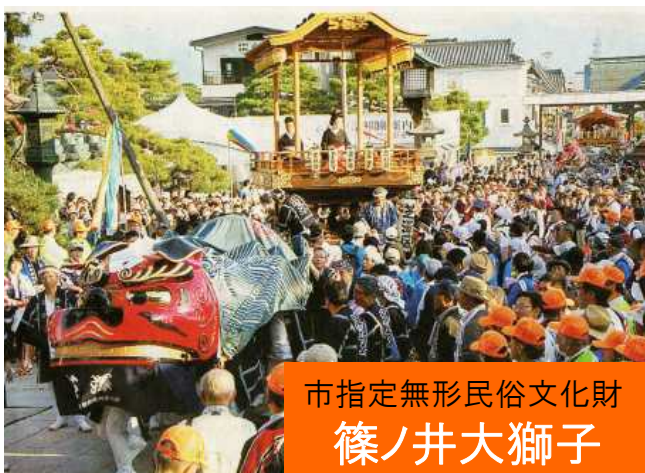
市指定無形民俗文化財 篠ノ井大獅子