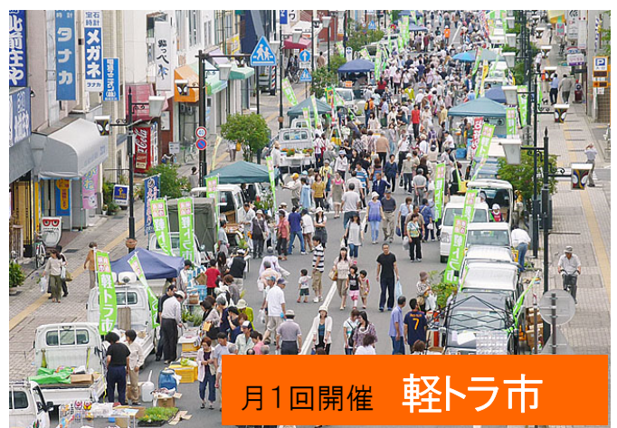
月1回開催 軽トラ市

川中島幹線の整備に伴い、新たなシンボルロードとして各種イベントの開催、地域活動の活発化とさらなる観光客の増加が期待される