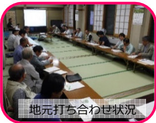
地元打ち合わせ状況